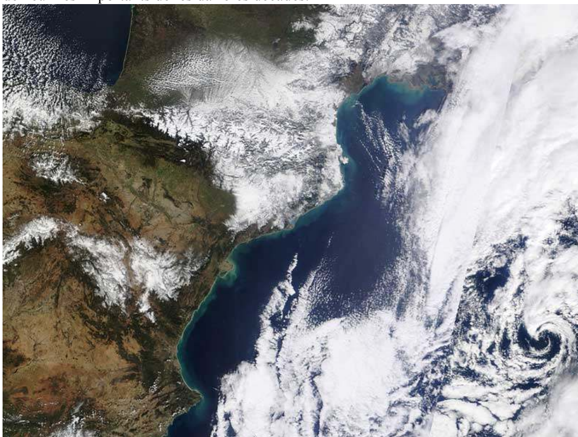
Imatge del NE de la península el dia 9.Observeu bona part de Catalunya blanca per la neu.

Tal com s'esperava entre els dies 7 i 8 de març, s'han barrejat dues masses d'aire,una molt freda centroeuropea i un altra d'humida mediterrània,provocant un dels temporals de neu més importants de les darreres dècades.